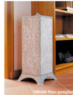
HRS600 Piuro granigliata

Le immagini dei campioni delle pietre e dei colori sono indicativi, non vincolanti e possono essere diversi dall'originale.