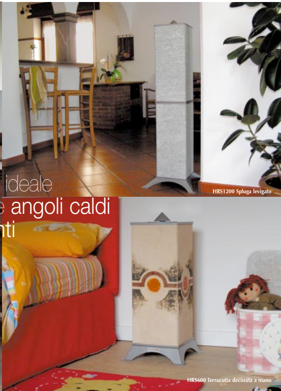
HRS1200 Spluga levigato