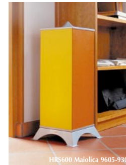
HRS600 Maiolica 9605-9300

Un modello per ogni singola esigenza Bassi consumi e ampie superfici di scambio le rendono ideali per trasformare in calore anche l'energia elettrica dei pannelli fotovoltaici