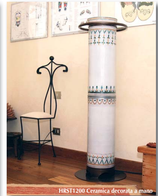
HRST1200 Ceramica decorata a mano