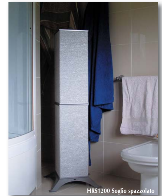
HRS1200 Soglio spazzolato

I campioni delle pietre e dei colori sono indicativi, non vincolanti e possono essere diversi dall'originale.