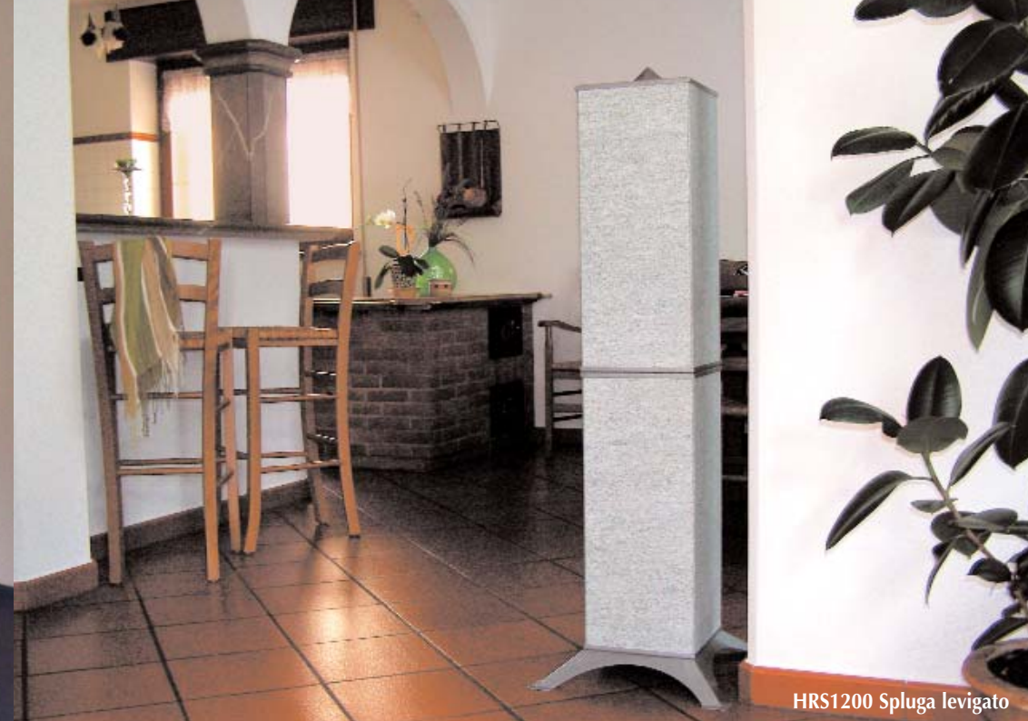
HRS1200 Spluga levigato

la soluzione ideale per ottenere angoli caldi e accoglienti