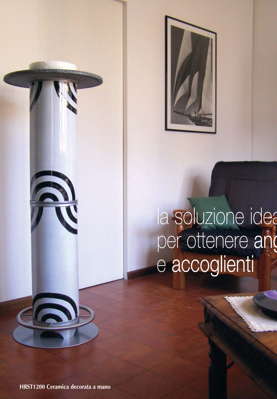
HRST1200 Ceramica decorata a mano

la soluzione ideale per ottenere angoli caldi e accoglienti