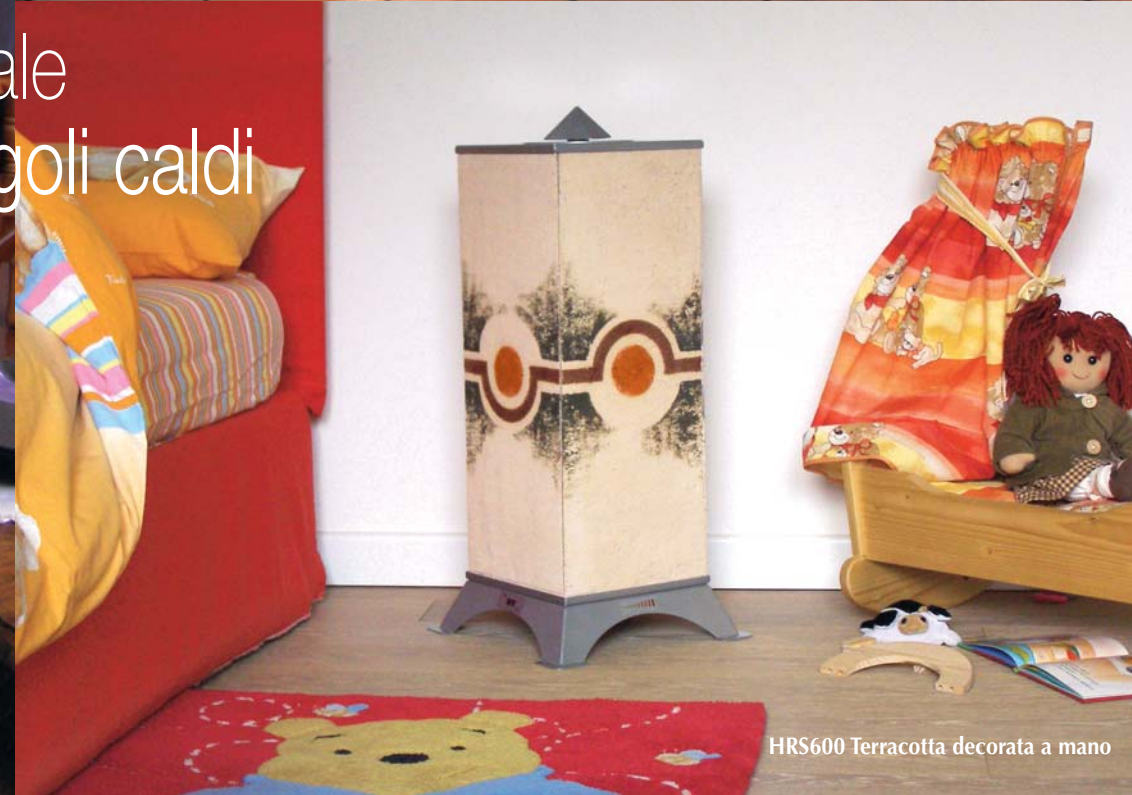
HRS600 Terracotta decorata a mano